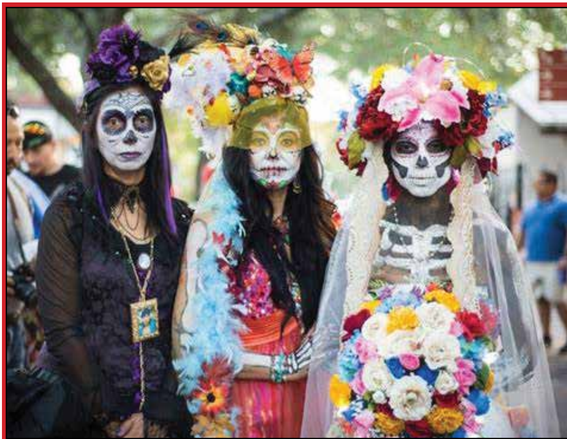
Día de los Muertos se visten como la diosa azteca Mictecacihuatl.