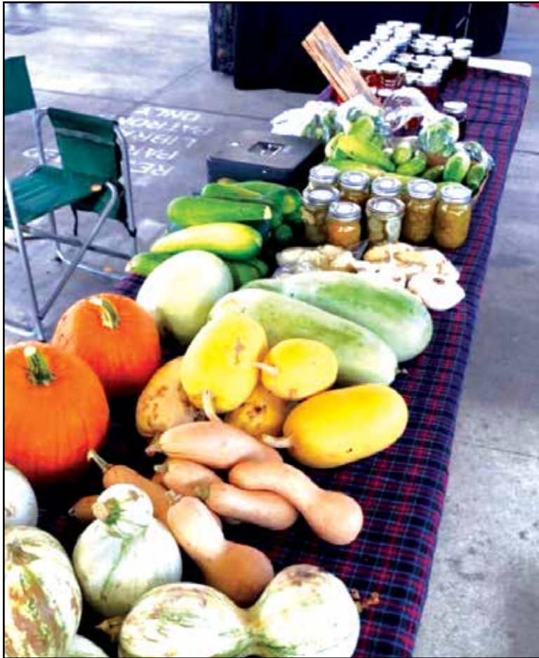
Fall's vegetables.