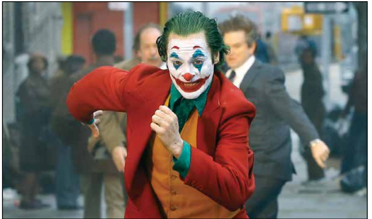
Joaquin Phoenix, The Joker.

Barnard 59 forma la boquilla de la nebulosa Pipe, que se destaca por las nubes de estrellas a su al-