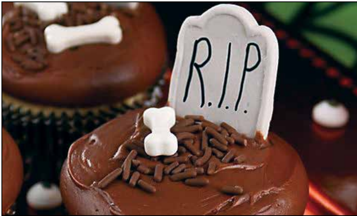
Cupcake graveyard. Contributed photo.