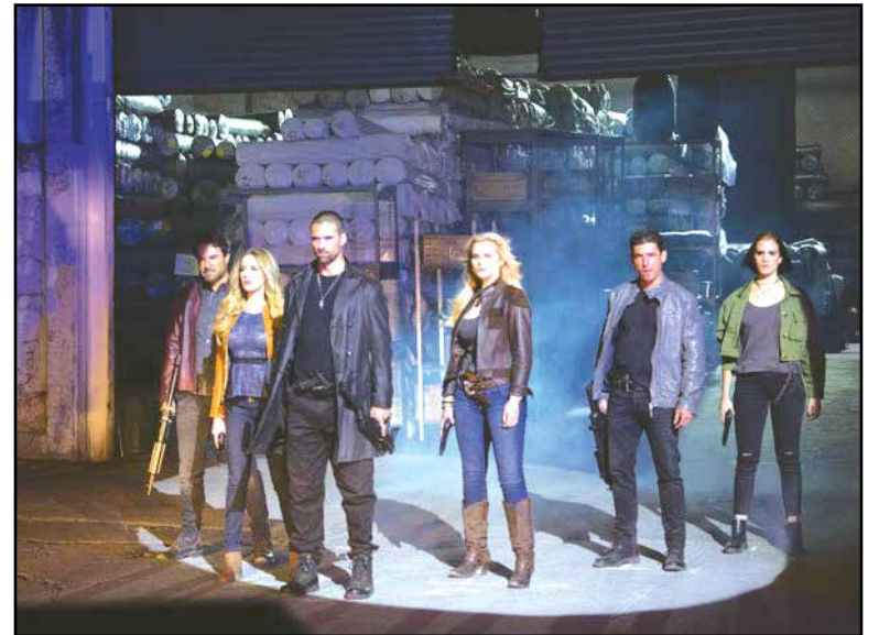
El Señor de los Cielos.

El Señor de los Cielos es la exitosa superserie que protagoniza