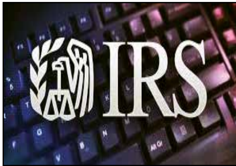
Renew ITINs with IRS. Contributed art.

from Tax Hikes (PATH) Act, ITINs that have not been used on a federal tax return at least once in the last three consecutive years will expire Dec. 31, 2018. In addition, ITINs with middle digits 73, 74, 75, 76, 77, 81 or 82 will also expire at the end of the year. These affected taxpayers who expect to file a tax return in 2019 must