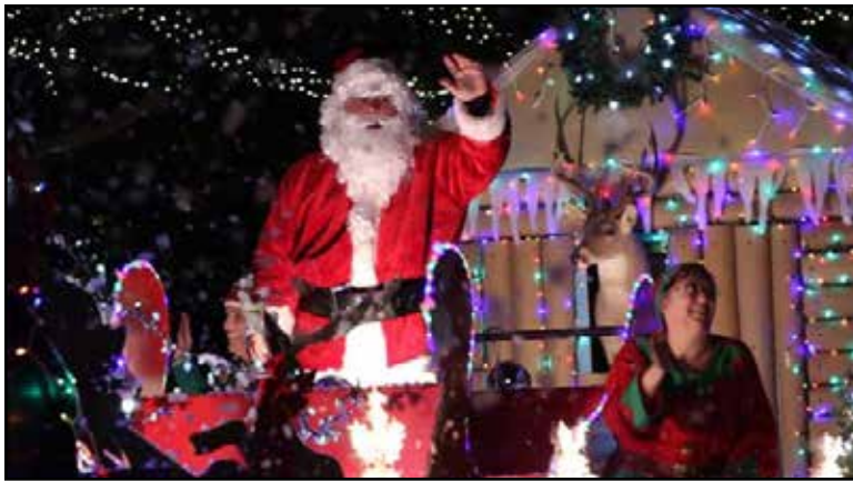
Santa waves to spectators during the Lighted Christmas Parade hosted by Victoria Parks & Recreation in 2015 in downtown Victoria.

The parade will return to downtown 6-9 p.m. Dec. 4, giving residents a chance to gaze in-person at lighted floats, car and motorcycle clubs, marching bands and more as they kick off the holiday season. The parade also will be livestreamed on Facebook at City of Victoria, Texas – Government.