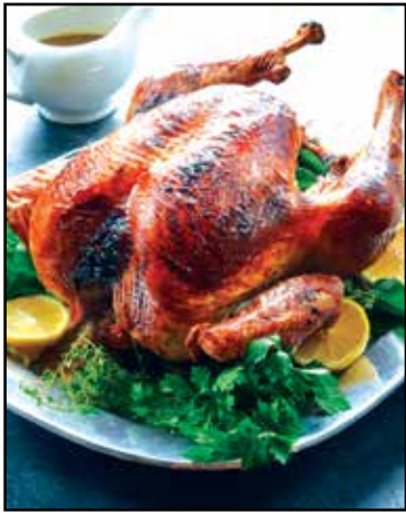
Citrus roasted turkey.