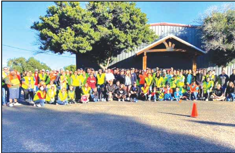
City employees and community members pose for a group photo Nov. 13 before the Parkway neighborhood cleanup hosted by Keep Victoria Beautiful.

About 130 volunteers helped residents to move brush and bulky trash to the curb at 79 locations in the neighborhood.