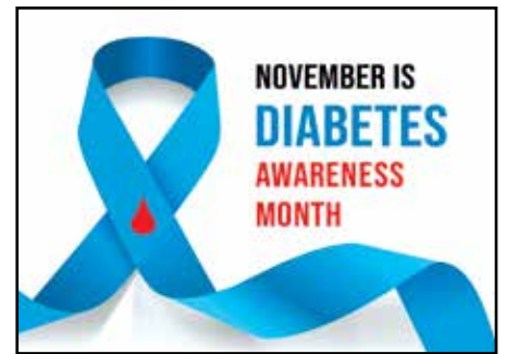
Protect eyes from diabetes. Contributed art.

Victoria Eye Center can help. The trained team at Victoria Eye Center is ready to diagnose diabetic retinopathy in the initial stages when there are no outward symptoms. This eye disease typically starts slowly, so you may not even know there is damage happening