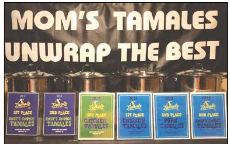
Award-winning tamales.

I had the opportunity to try the chicken, jalapeno, and cream cheese tamale, the "barria" meat used in their tamale, quesadillas, and tacos, the actual barria sauce