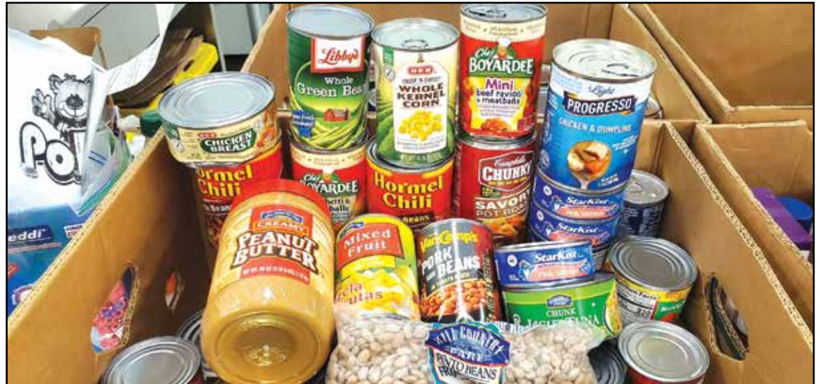
Donate canned goods during the holidays. Contributed photo.