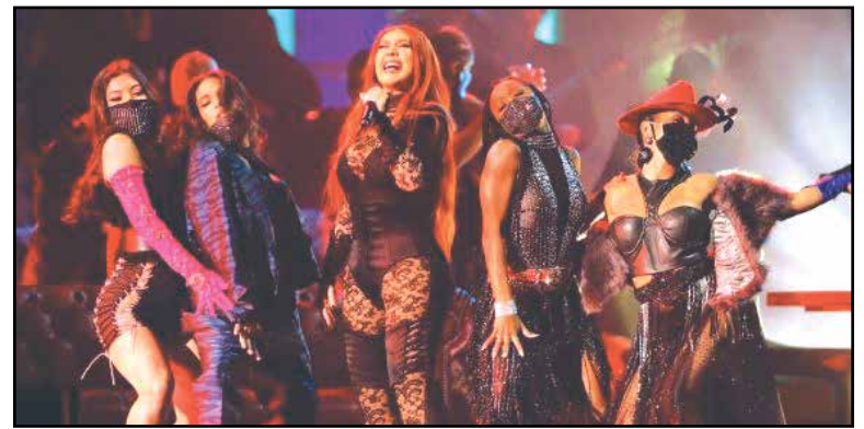
Christina Aguilera.