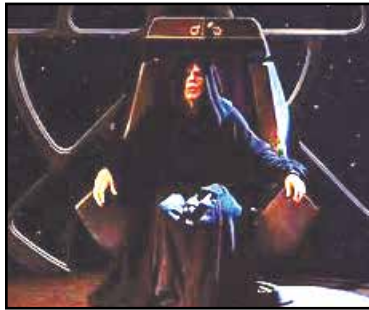
Lord Palpatine-Ian McDiarmid. Contributed photo.

Una de las escenas de la cinta “Avengers: Endgame,” que se estrena el 26 de abril. Son más las especulaciones sobre Avengers: Engame que el número de super-