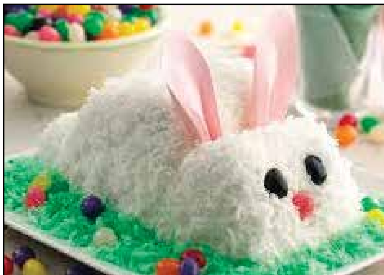
Cool bunny dessert.