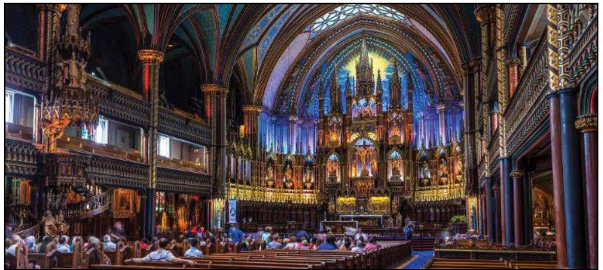
Notre Dame Cathedral church.