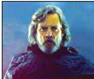
Luke Skywalker-Mark Hamill.

El salto al ruedo de Capitana Marvel, de quien se dijo que sería el personaje más poderoso de todo ese imperio, aportó elementos a la discusión y, tan pronto se conoció el alcance del rol a cargo de Brie Larson, se comentó que tal vez ella tendría el encargo vital de hacerle frente a Thanos, el Titán Loco, y frenarle su espíritu destructor.