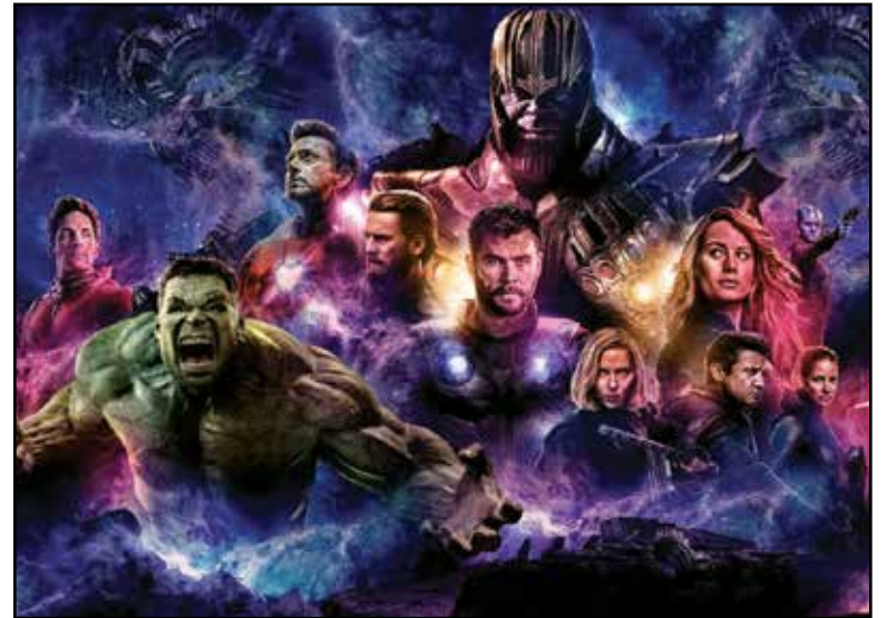
Endgame characters art.

Carol Danvers, el nombre de pila de esta superheroína, se vinculó a la atmósfera de los Vengadores (Avengers) en una de las famosas escenas poscrédito de la cinta Infinity War, cuando Nick Fury (Samuel L. Jackson), antes de desvanecerse, le hace un llamado de auxilio.