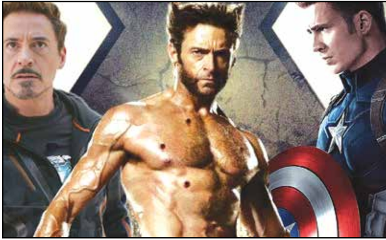
Endgame: Iron man, Wolverine and Captain America.

CHARLANDO , from pg. 8 el director J.J. Abrams a propósito del lanzamiento del tráiler del Episodio IX de “Star Wars,” con el que se pone punto final a la saga.