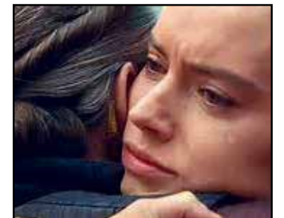
Rey-Daisy Ridley.

¿Qué hay detrás del título “The Rise of Skywalker”?